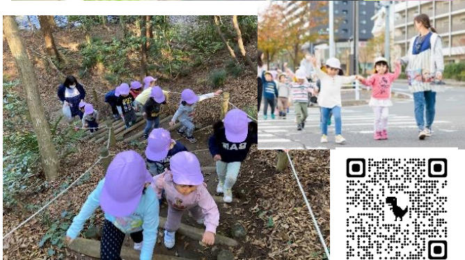
流山市 HP 掲載記事