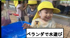
ベランダで水遊び