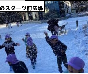
冬のスターツ前広場