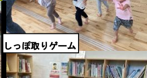
しっぽ取りゲーム