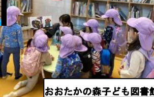
おおたかの森子ども図書館