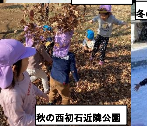
秋の西初石近隣公園