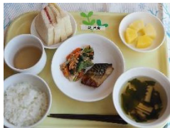
昼食とおやつ用のジャムサンド →

・「食べることは生きること」、安全安心を確保し、食べる意欲を育てる給食づくりに励んでいます。和食を中心に、白米をおいしく食べることができるおかずを多く取り入れています。季節感や行事食を大切に、旬の食材を利用したり、保育室から調理室を見学したりして、食べることへの意欲を育みます。